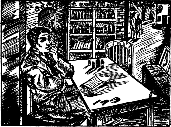
औषधापुरतंहि गिऱ्हाईक नसलेला भाऊचा दवाखाना

पण तो गृहस्थ औषधाकरितां आला नव्हता. 'तुम्ही दवाखाना बंद करणार असाल तर मला हें दुकान भाड्यान द्या' असं सांगायला आला होता. सकाळीं ७ ते १२ अन् संध्याकाळीं ४ ते ८ असे ९ तास तो खुर्चीवर बसून घालवी. चुकूनसुद्धां कोणी त्याच्याकडे औषध मागायला येत नसे. जाणाऱ्या येणाऱ्या प्रत्येक माणसाकडे आशाळभूतपणें पाहून कंटाळल्यावर एकादं पुस्तक हातांत घेऊन त्याचीं पानें चाळीत चाळीत चोरट्या नजरेनं तो लोकांकडे पाही. दोन्ही पाय खालीं सोडून कंटाळल्यावर डावा पाय उजव्या मांडीवर ठेवून बसे. त्या स्थितींत